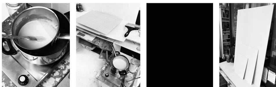
Planche 5 : Application de l'enduit

Et ainsi de suite pour toutes les opérations préparatoires qui assureront la stabilité d'une peinture, et qui n'auront plus qu'à être reproduites par l'utilisateur si un souci de sa tenue est retrouvé, ou si l'engouement pour les formes d'artisanat l'emporte sur le reste - quoique cet engouement conduise parfois à des postures superficielles sinon incohérentes 50 .