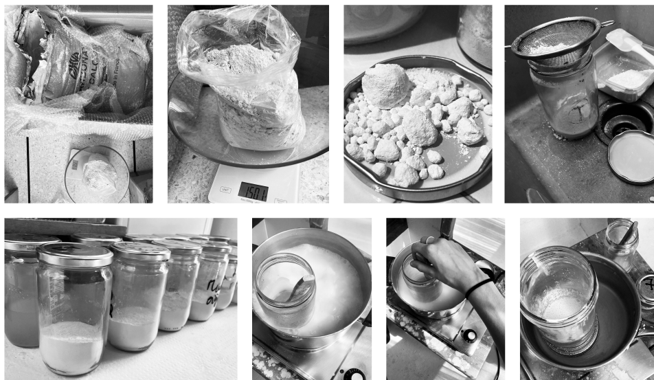
Planche 4 : Préparation d'un enduit

Une fois opérés ces premiers encollages, que l'on aura pris soin de détailler avec le plus d'éléments utiles à son exécution, depuis la composition des solutions et la façon de réchauffer les colles au bain-marie jusqu'au moyen d'appliquer ces dernières sur le support, pourra s'ensuivre l'enduction, que l'on présentera de la même manière, de la façon la plus claire possible.