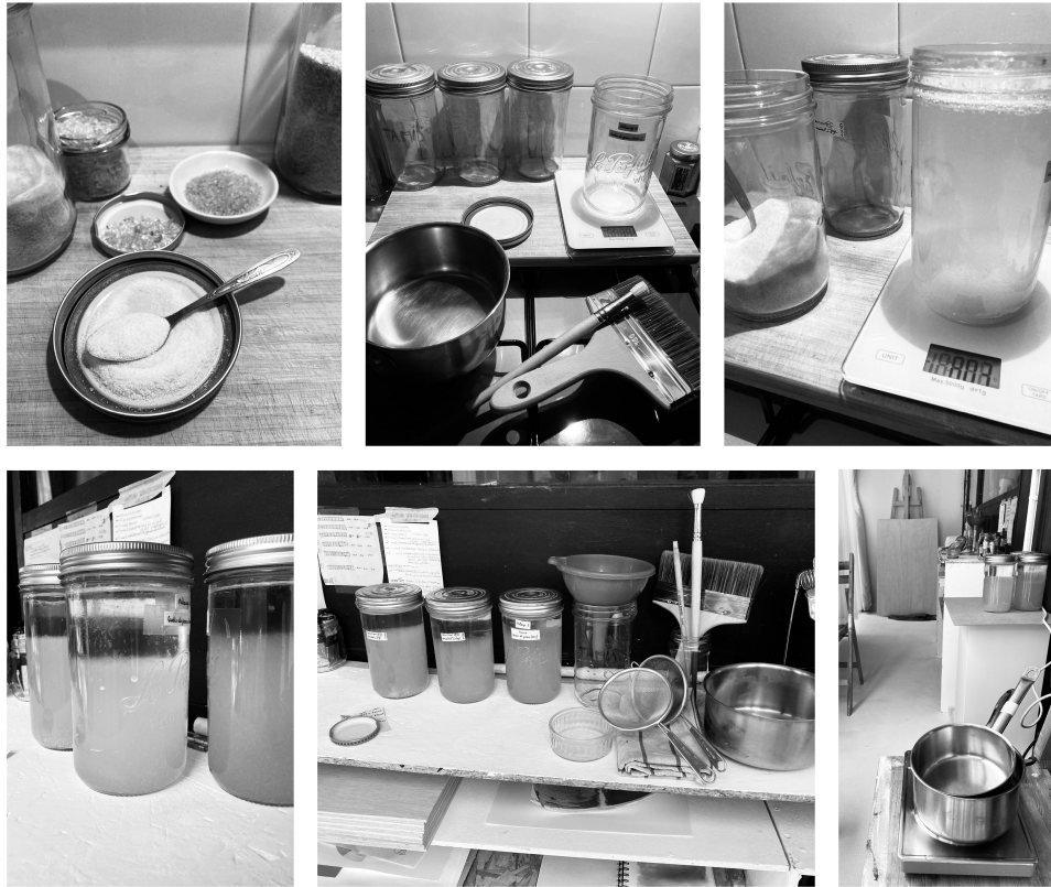
Planche 1 : Préparation d'une colle de peau

Dosages et pesées la veille de poudre de résidus organiques - Mise à tremper durant une nuit - Colle gorgée d'eau - Installation et mise en place des outils afin de réaliser les encollages.