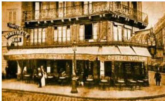
Fig 3 : Le Grand Café Pigalle ou Le Rat Mort, 7 place Pigalle, Paris 9e, Photographie non datée.