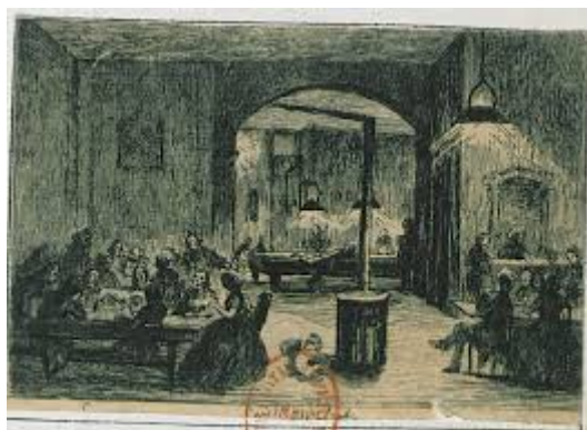
Fig 4 : Courbet, La Brasserie Andler , 1848, rue Hautefeuille, Paris 6e.

La parole y est spontanée : des conversations intenses, des récitations imprévues juchées sur les tables ou chuchotées à l'oreille ce qu'affectionnait particulièrement Baudelaire, mais encore des chansons et des sketches s'invitent régulièrement dans les estaminets. Mais si l'espace public est aimé des écrivains, il n'offre peut-être pas la tranquillité nécessaire à l'élaboration d'une œuvre, d'une esthétique collective qui pourrait permettre à ces œuvres orales de se transformer en œuvre écrite. Le cas des Hydropathes le montre. Le 5 octobre 1878, cinq poètes, qui « di[sent] des vers 19 » au premier étage du café le Rive Gauche, autour d'un piano mis à la disposition du tout venant, sont interrompus par des lycéens fêtards du quartier. Goudeau, Abram, Lorin, Rives et Rollinat, ainsi empêchés, font une demande auprès du patron du café : il leur faut un espace réservé, une fois par semaine. Pour amortir la location, chacun s'engage à venir accompagné d'amis partageant leur goût pour les lettres. Le premier vendredi, jour arrêté, ils sont 75. Rapidement le cabinet du café devient trop petit. Un local réservé à ces réunions est alors loué. Le club des Hydropathes ouvre ainsi ses portes le 17 octobre 1878 et ne les refermera qu'en 1880 20 . Les années 1880, avec la libéralisation de la vie culturelle, le développement des « cabarets artistiques » et la démocratisation du public, marquent le début d'une nouvelle ère de la culture orale.