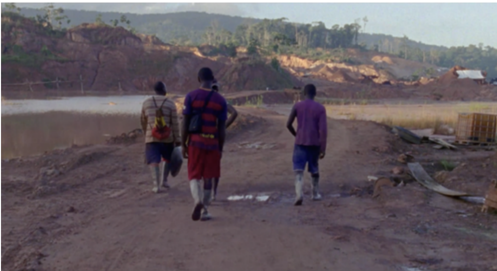
Figure 2 : Marches d'approches.