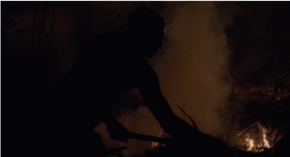
Figure 3 : Départs de feux