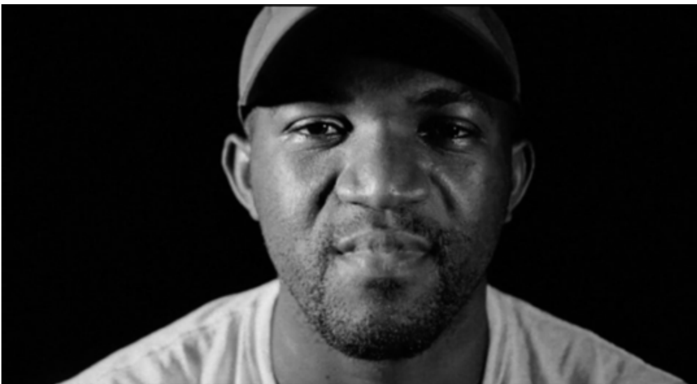
Figure 4 : Visages de mineurs.