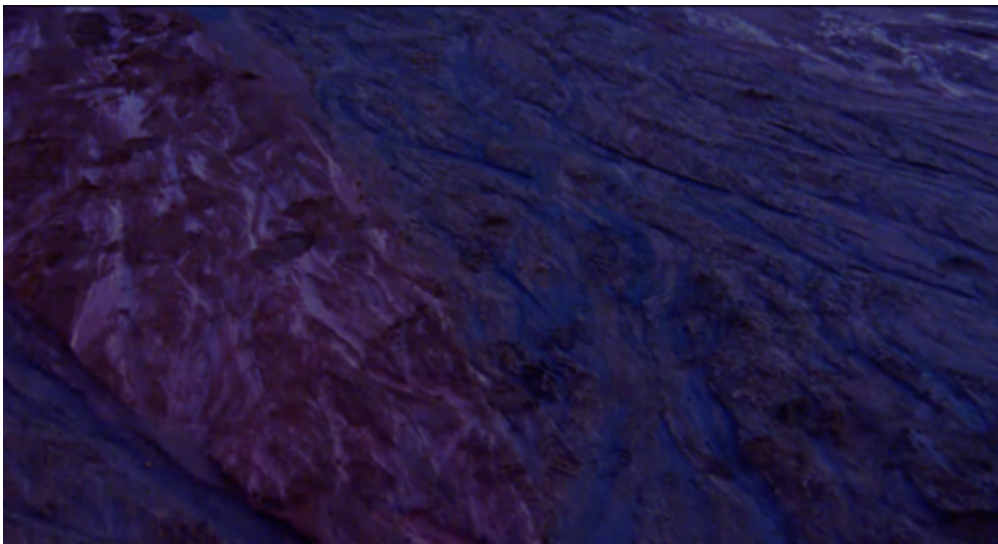
Figure 8 : Au repos.