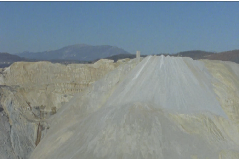
Figure 1 : Le cercle divisé ( Good Luck ).