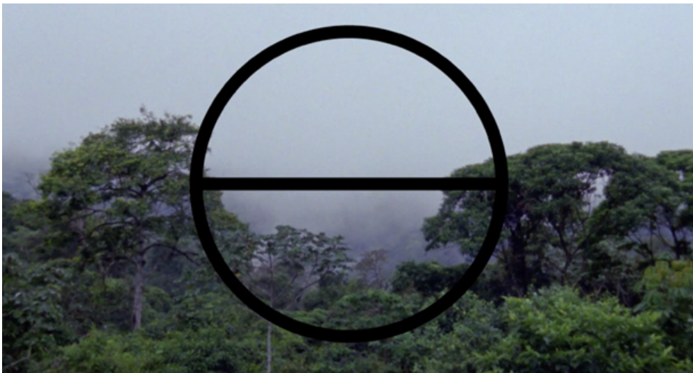
Table des figures :

Stults Chris, « A Journey Through Different Worlds », Viennale Catalog , n° 9, 2009, p. 20